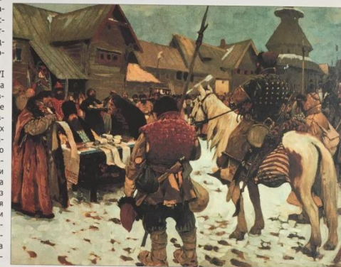
С. В. Иванов. Смотр служилых людей. Издание И. Н. Кнебель.

таким европейским городам, как Лондон, Венеция, Амстердам и Рим.