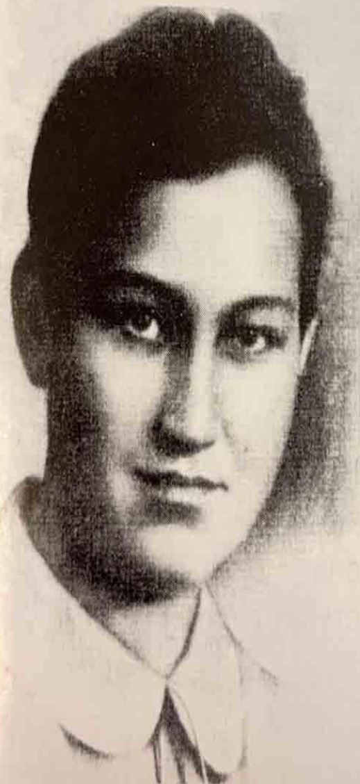
Герой Советского Союза Зоя Космодемьянская